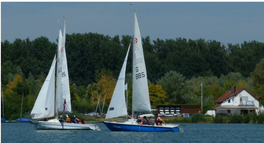
Ausbildungsjolle vom Typ Conger vor dem Clubheim des SCRR

Die praktische und theoretische Ausbildung zum Führen von Segelfahrzeugen findet auf dem Gelände des Segelclubs Ratisbona e.V. Regensburg (SCRR) am Guggenberger See statt. Die praktische Segelausbildung wird auf Segeljollen vom Typ Conger und Kielzugvogel durchgeführt, die Zusatz-Theorieprüfung Segeln findet im Clubhaus des SCRR statt.