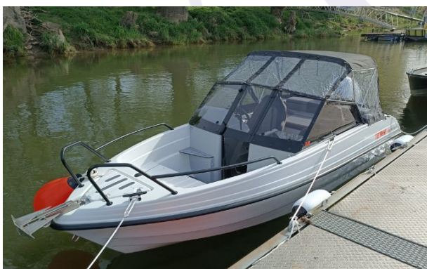
Ausbildungs-Motorboot Terhi 480 BR

Der Segelclub Ratisbona e.V. Regensburg veranstaltet in Zusammenarbeit mit der Motor- und