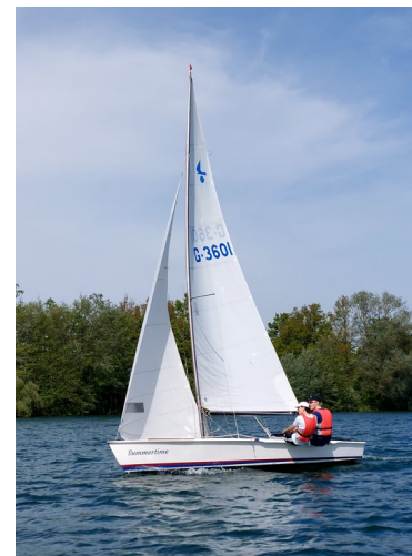
Ausbildungsjolle vom Typ Kielzugvogel

Die Ausbildung beim SCRR setzt keine Segelkenntnisse voraus. Das Segeln wird von Grund auf erlernt und führt zur sicheren Prüfungsreife und darüber hinaus.