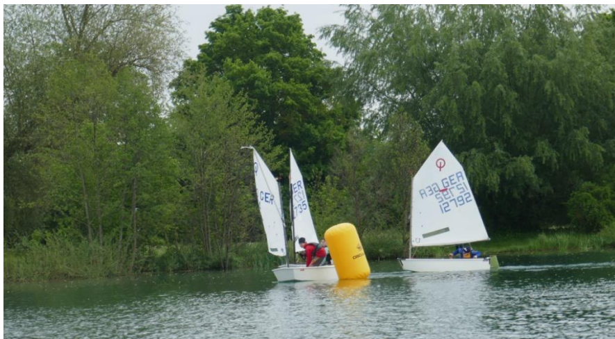
Rundung der Leetonne in der dritten Wettfahrt